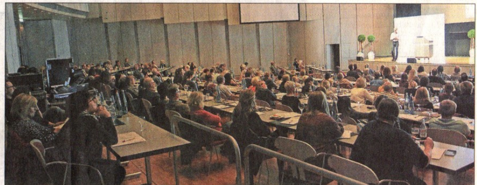
Rund 160 Gäste und zahlreiche Referenten nahmen an der dreitägigen Fachtagung des Sozialpsychiatrischen Hilfsvereins (SPHV) im Palatin teil. Thema war das Betreute Wohnen von Menschen mit einer psychischen Behinderung in Gastfamilien.